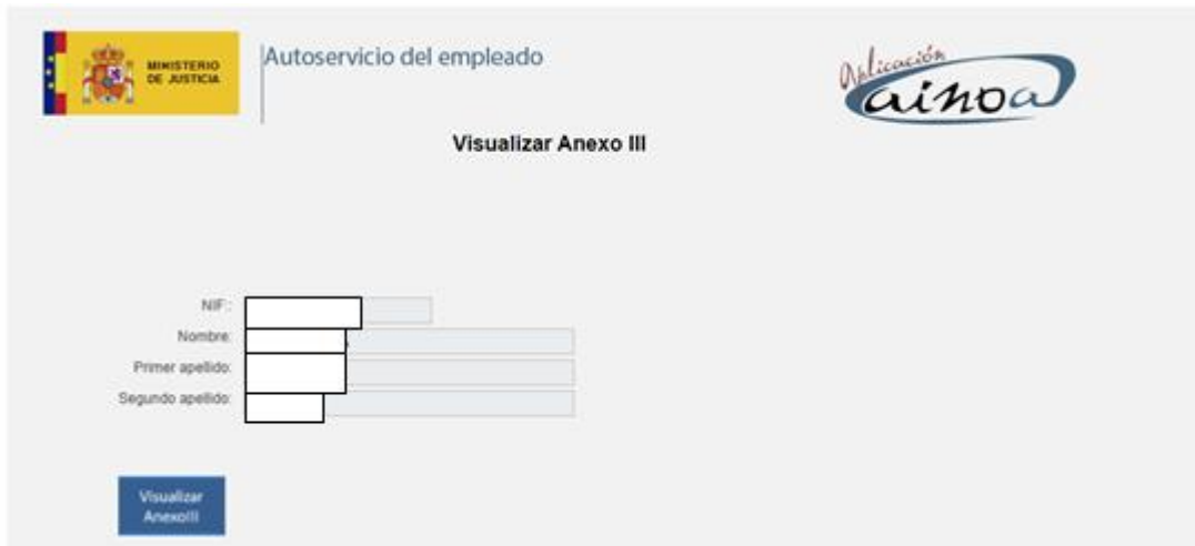
Figura 2 – Datos personales de Cl@ve

Una vez realizada la identificación electrónica navegará a la siguiente pantalla.